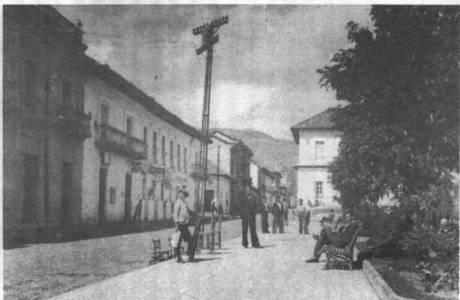
Calle y Parque Bolívar