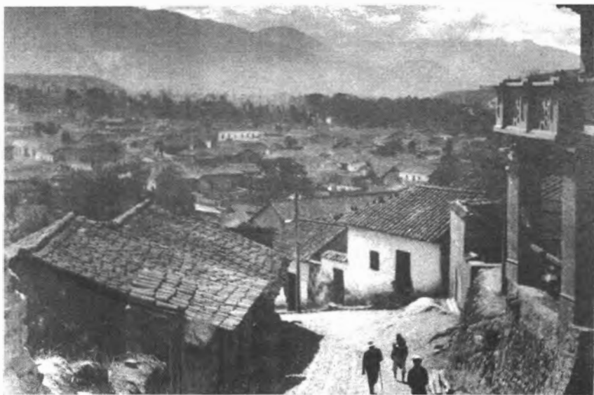
Calle del Empedrado