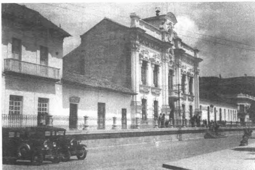
Calle García Moreno