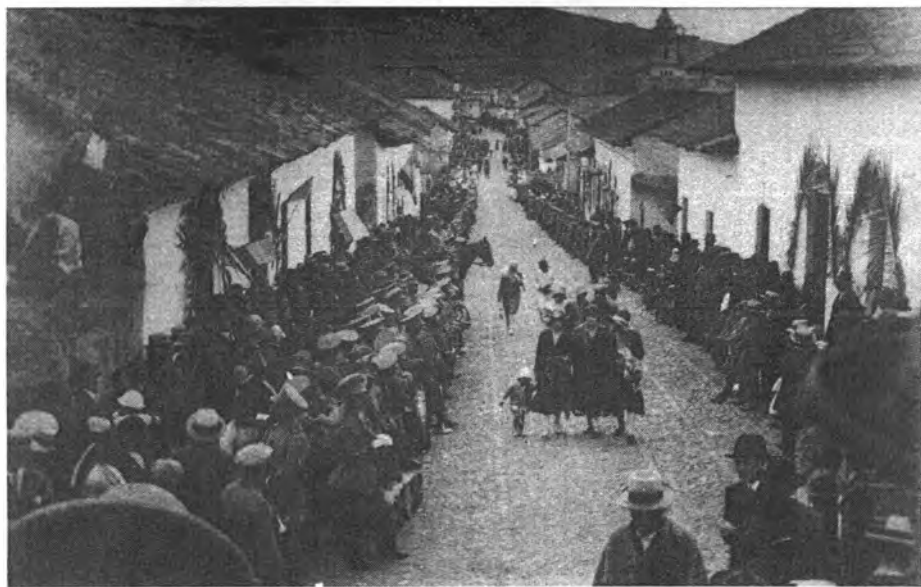
Calle García Moreno