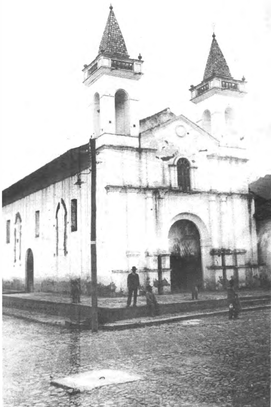
Calles Bolívar y Olmedo