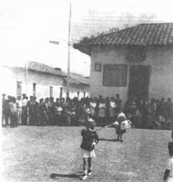
Calles Sucre y Juan Montalvo