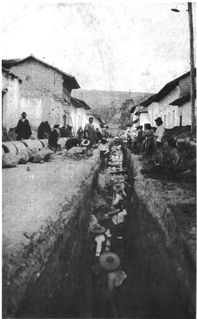
Calle Colón.