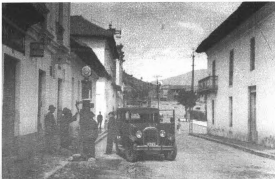
Calle García Moreno