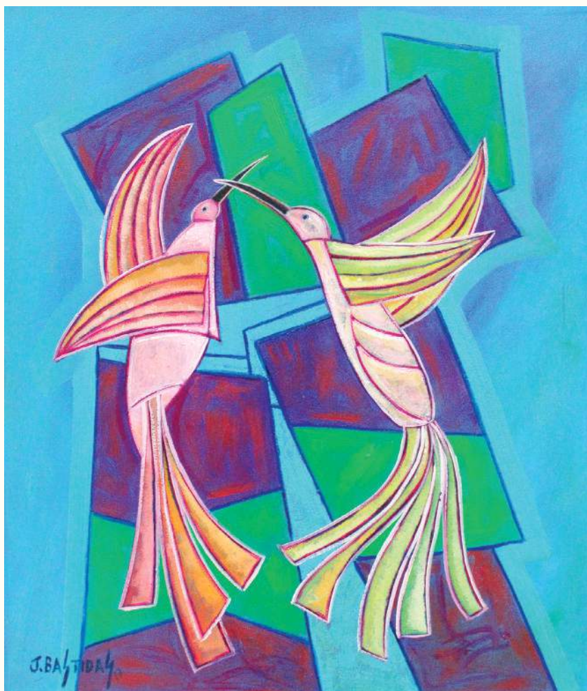
BAILOTEO ÓLEO SOBRE LIENZO 70x60