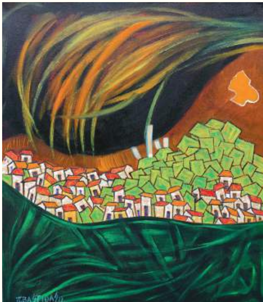
PAISAJE ANDINO ÓLEO SOBRE LIENZO 70x60