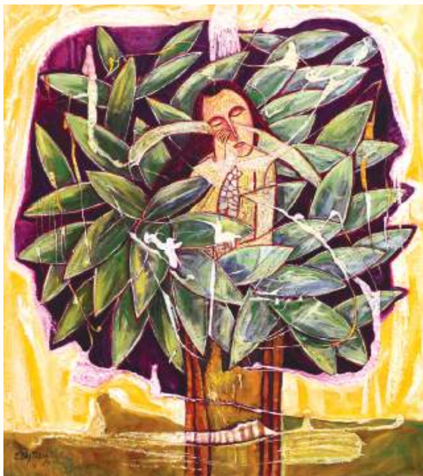
GENEALOGÍA MÁGICA ÓLEO SOBRE LIENZO 70x60