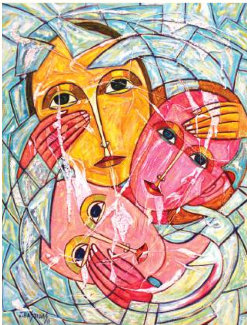
FAMILIA ÓLEO SOBRE LIENZO 100x70