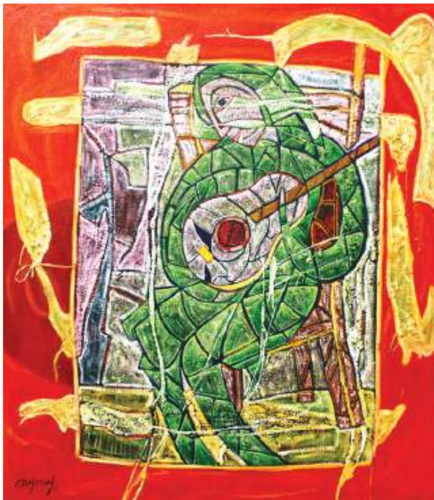
ARMONÍA II ÓLEO SOBRE LIENZO 70x60