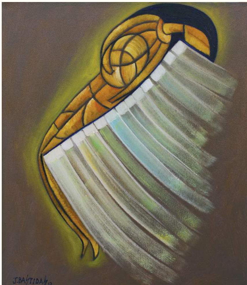
EN ESPERA ÓLEO SOBRE LIENZO 70x60