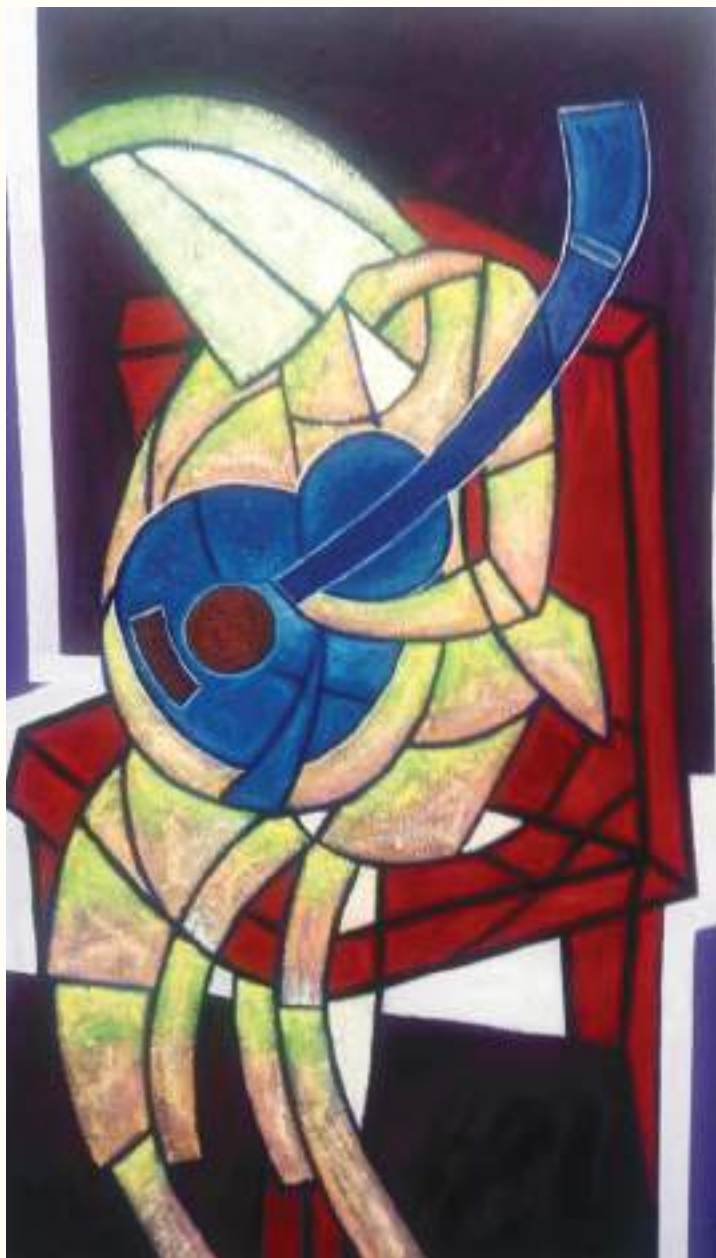
PLATEA ÓLEO SOBRE LIENZO 100X70