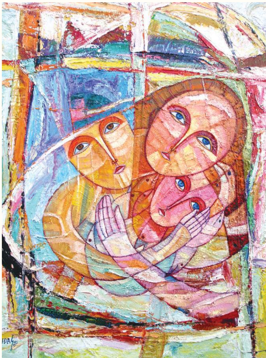
FAMILIA ÓLEO SOBRE LIENZO 87x75