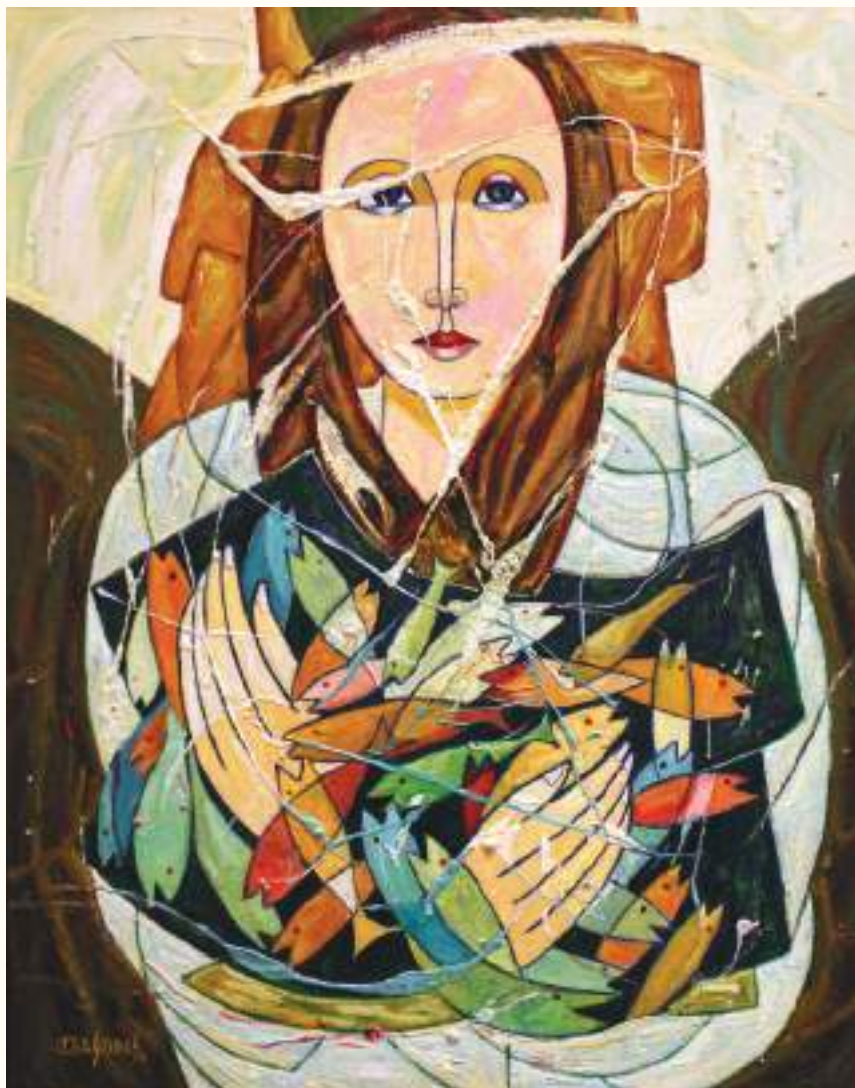
PROTECTORA ÓLEO SOBRE LIENZO 80x70