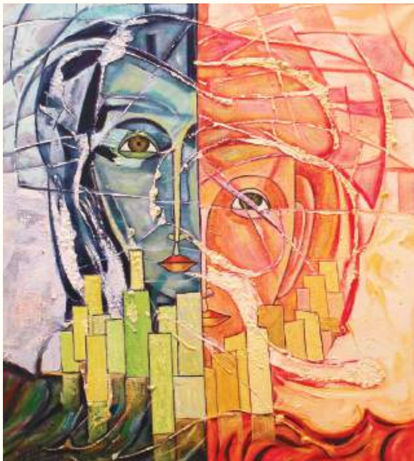
PAREJA EN UNA METRÓPOLI ÓLEO SOBRE LIENZO 60x60