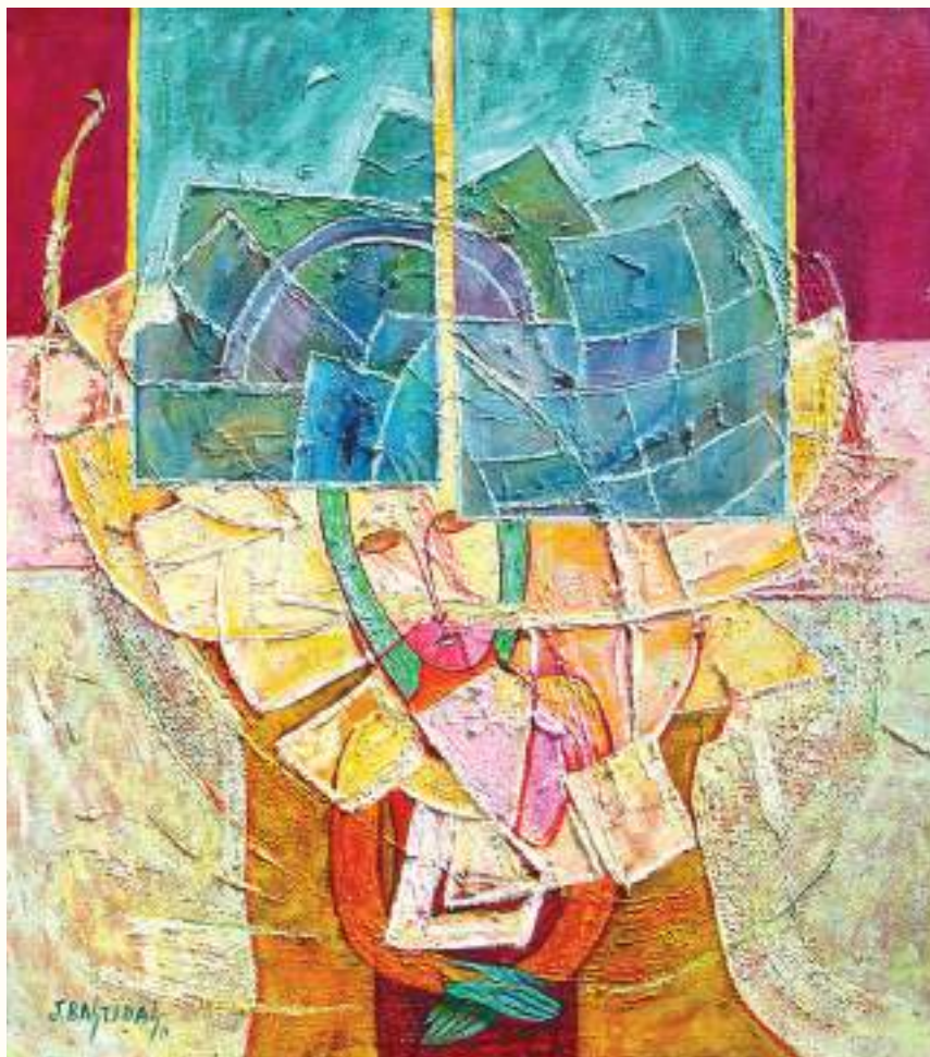
APESADUMBRADA ÓLEO SOBRE LIENZO 100x90