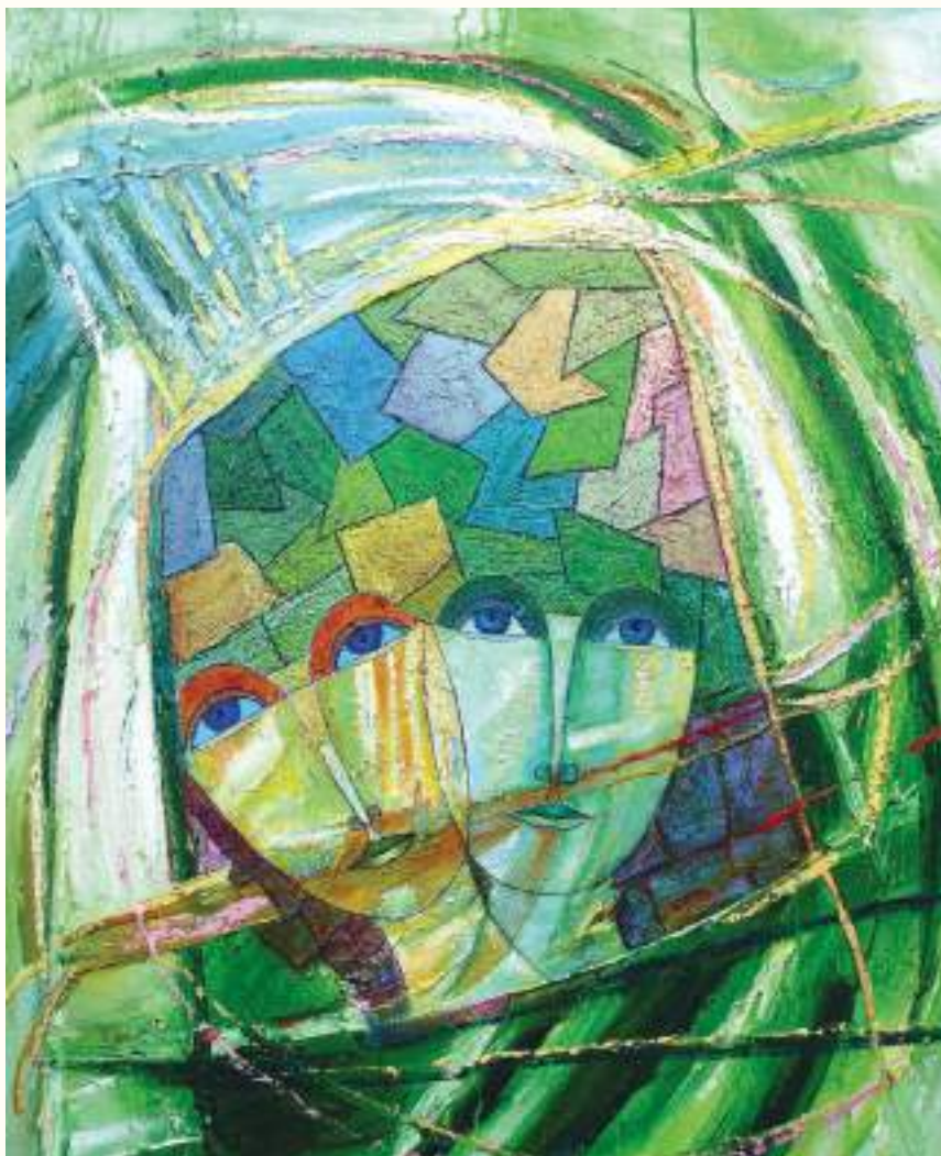
ANDINOS ÓLEO SOBRE LIENZO 87x75