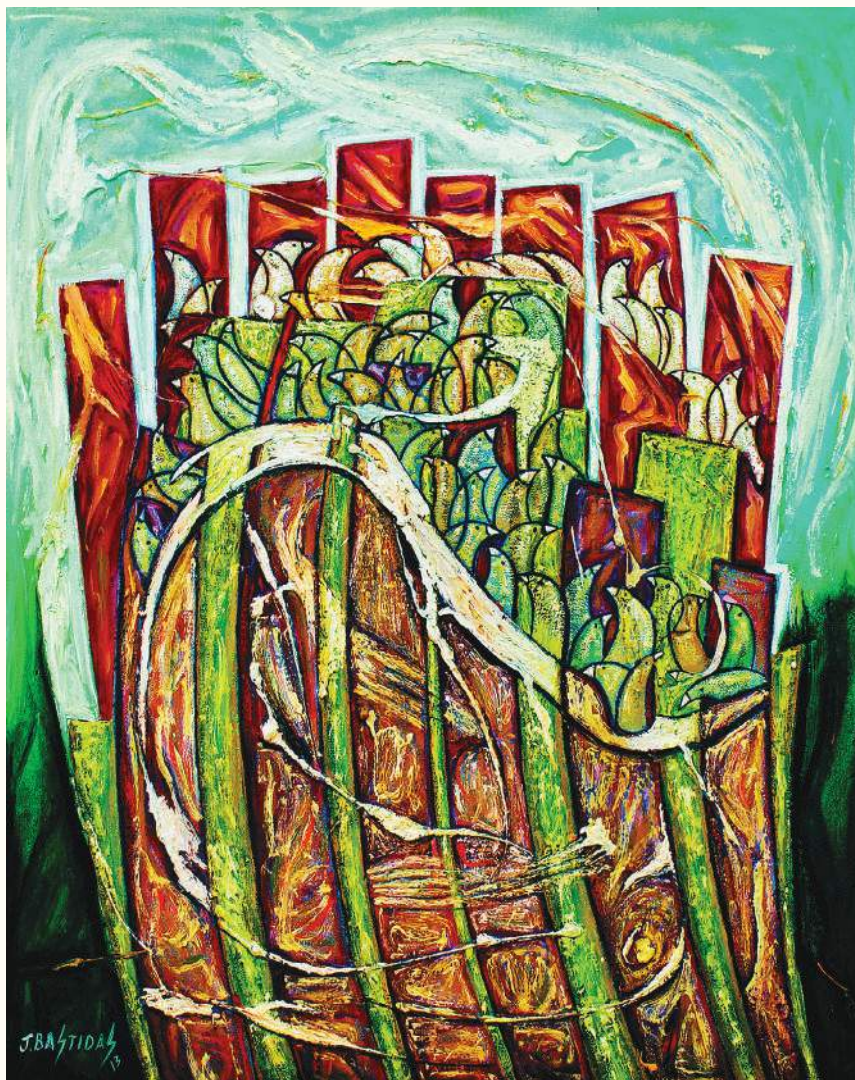
JUNCOS ÓLEO SOBRE LIENZO 100x80