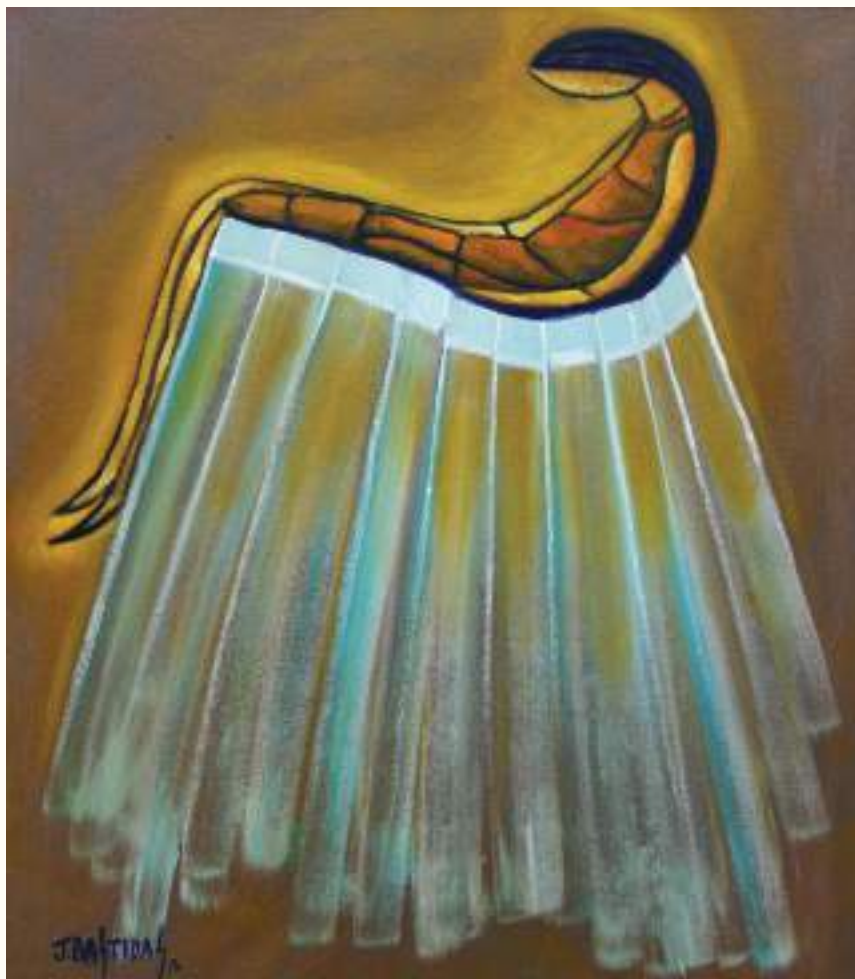
DESCANSO ÓLEO SOBRE LIENZO 70x60