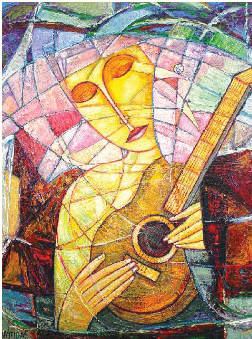
ARMONIA ÓLEO SOBRE LIENZO 100x90