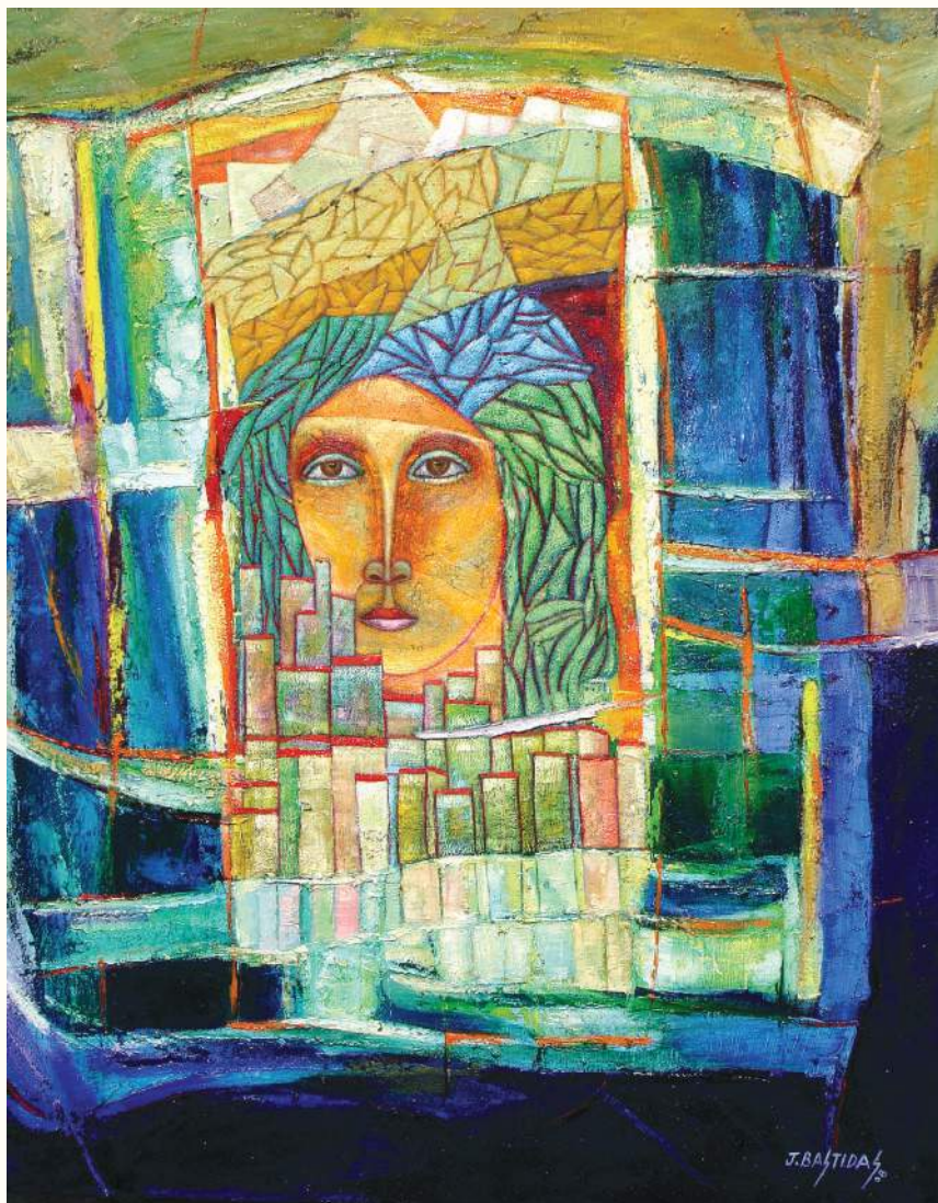
MIRADA ÓLEO SOBRE LIENZO 100x80