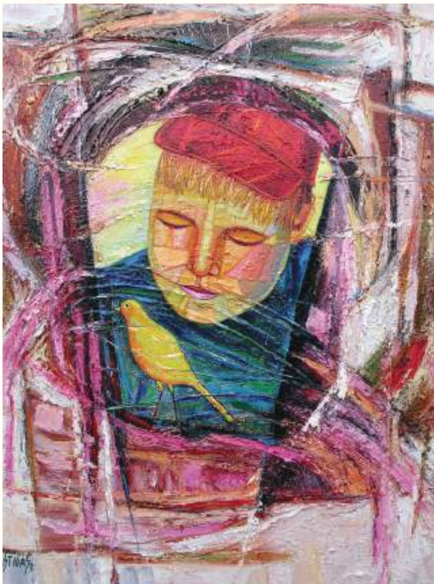
TERNURA ÓLEO SOBRE LIENZO 90x75