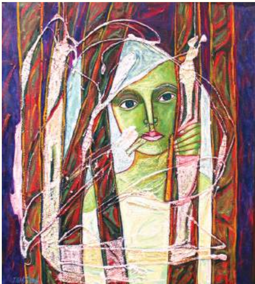
VIGILIA ÓLEO SOBRE LIENZO 70x60