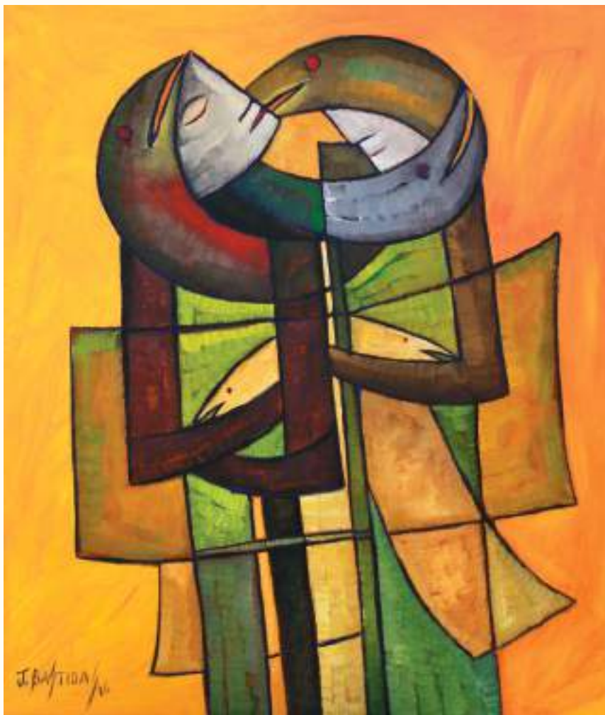
ZOOMORFO II ÓLEO SOBRE LIENZO 70x80