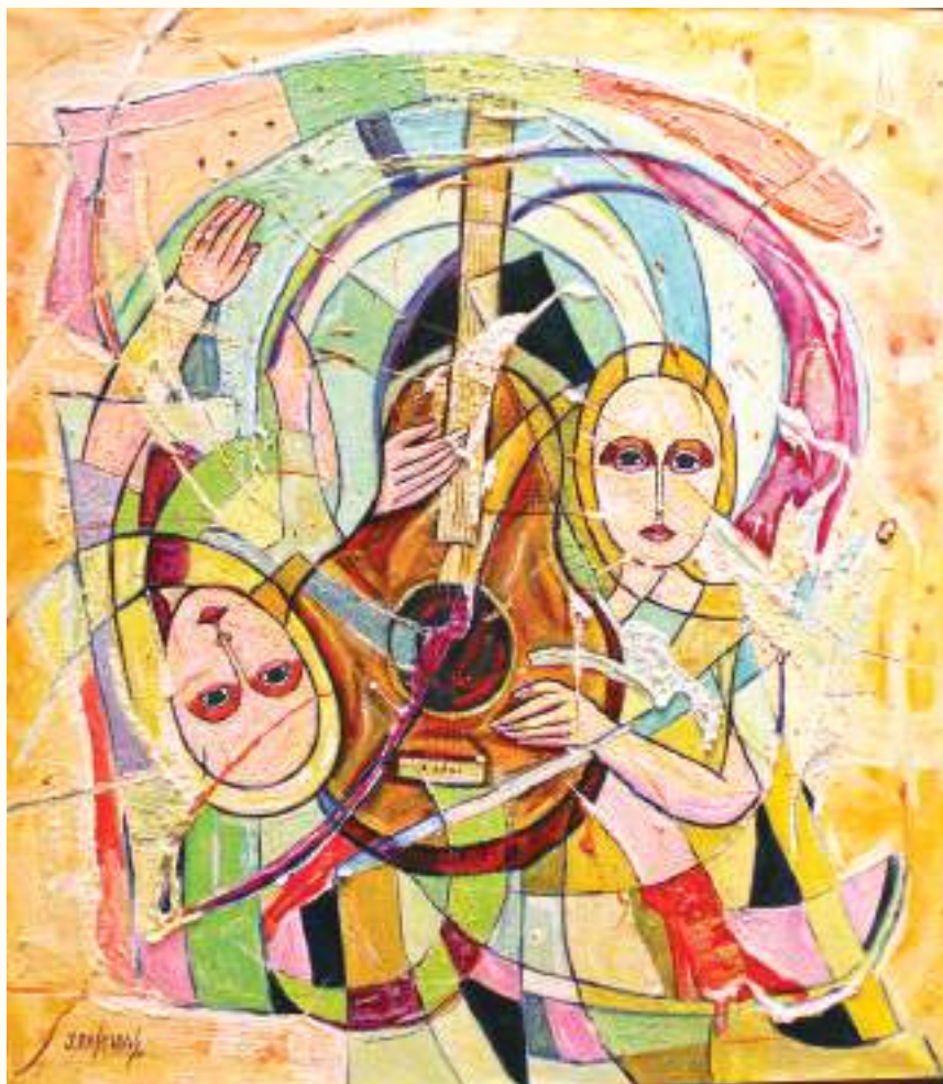
ARMONÍA I ÓLEO SOBRE LIENZO 70x60