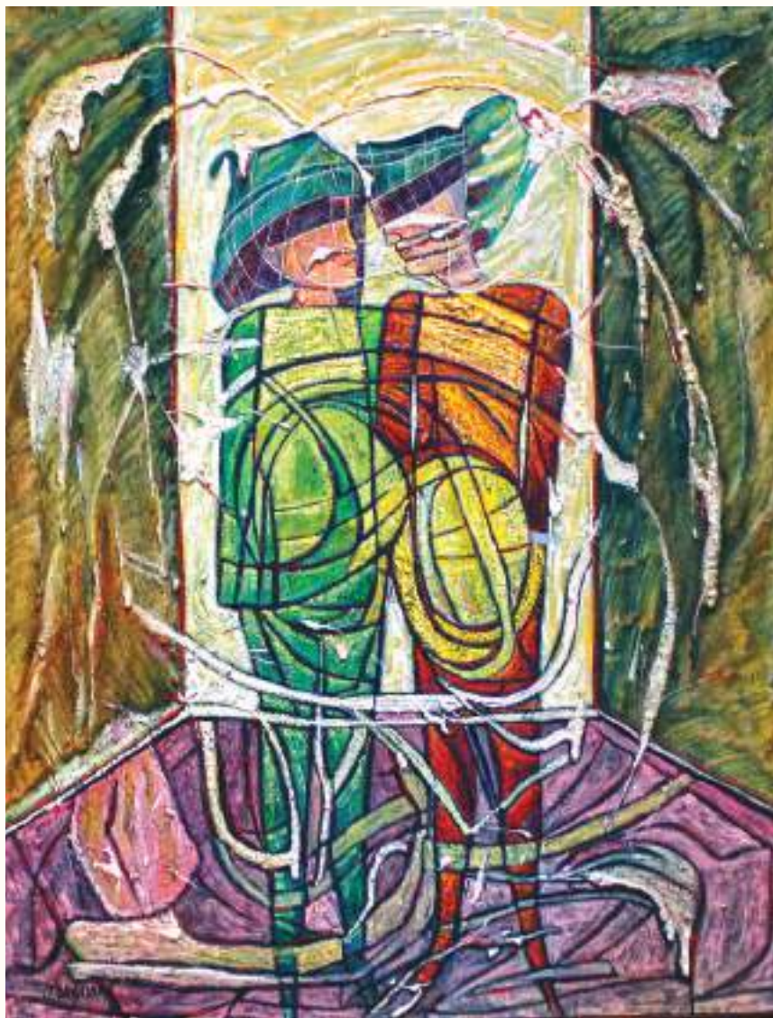
RUN RUN ÓLEO SOBRE LIENZO 80x70