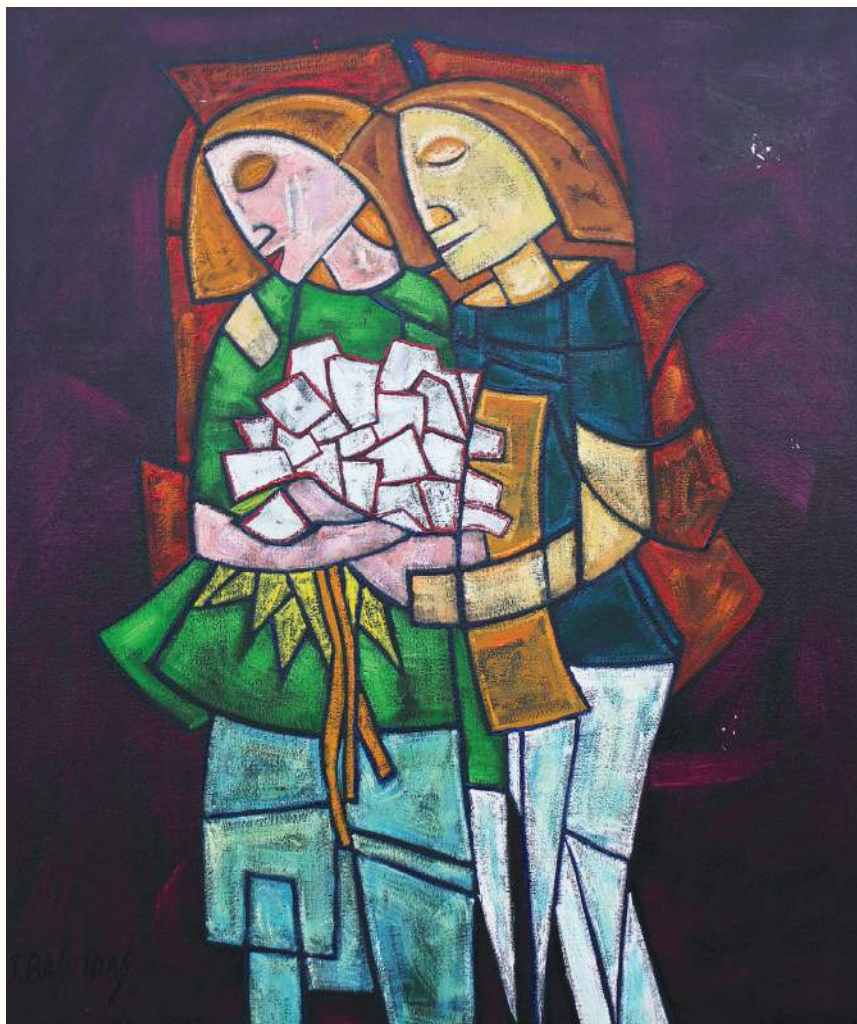
PAREJA ÓLEO SOBRE LIENZO 100x90