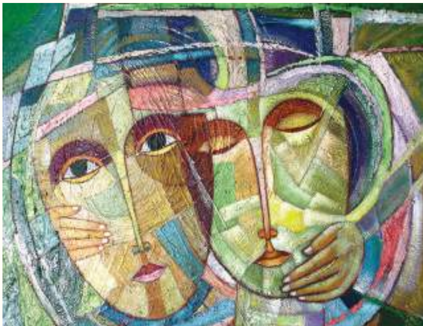
ABRAZO ÓLEO SOBRE LIENZO 80x70