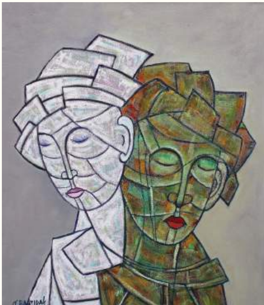
PAREJA ÓLEO SOBRE LIENZO 70x60