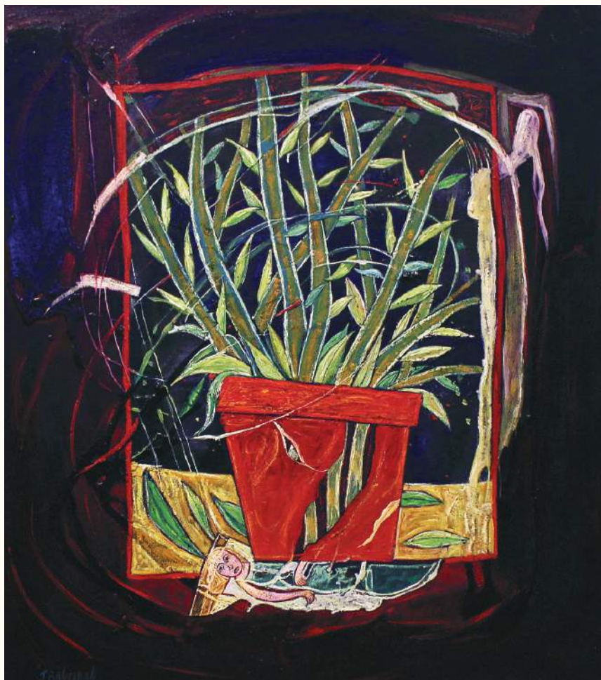
MACETA ÓLEO SOBRE LIENZO 70x60