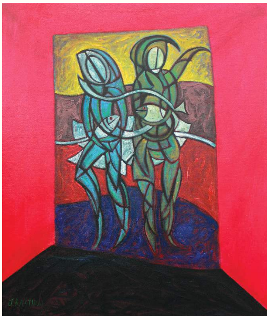
ZOOMORFO I ÓLEO SOBRE LIENZO 80x70