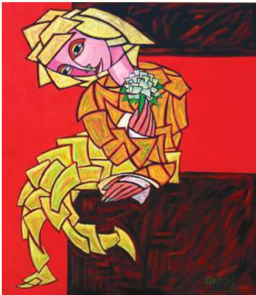
EN ESPERA ÓLEO SOBRE LIENZO 80x70