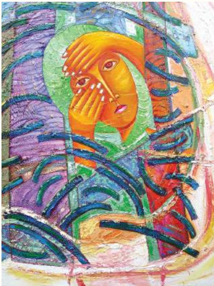
SOLEDAD ÓLEO SOBRE LIENZO 87x75