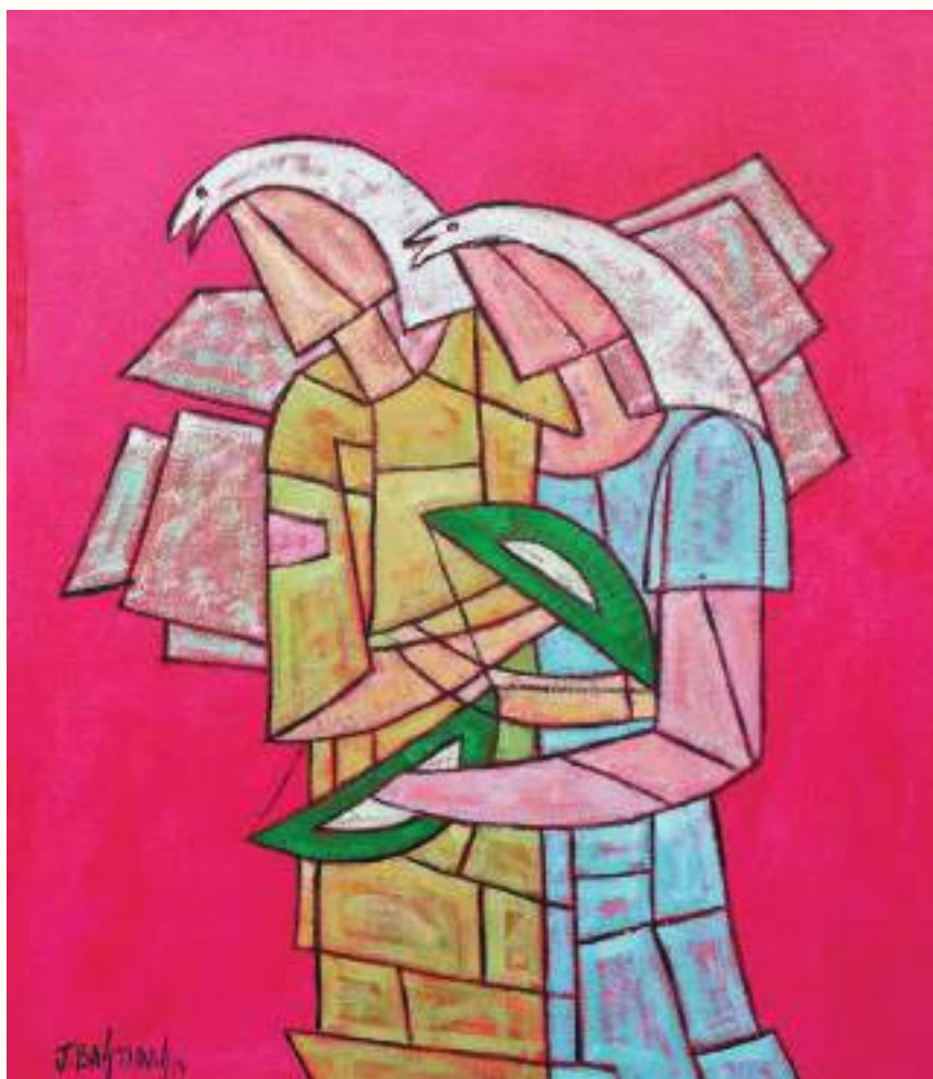
TUTANKAMÓN Y ANJESENAMÓN ÓLEO SOBRE LIENZO 70x60