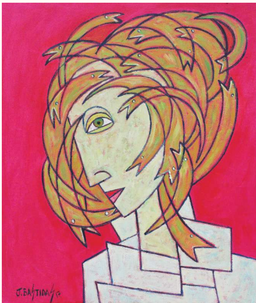
ZOOMORFA ÓLEO SOBRE LIENZO 70x60