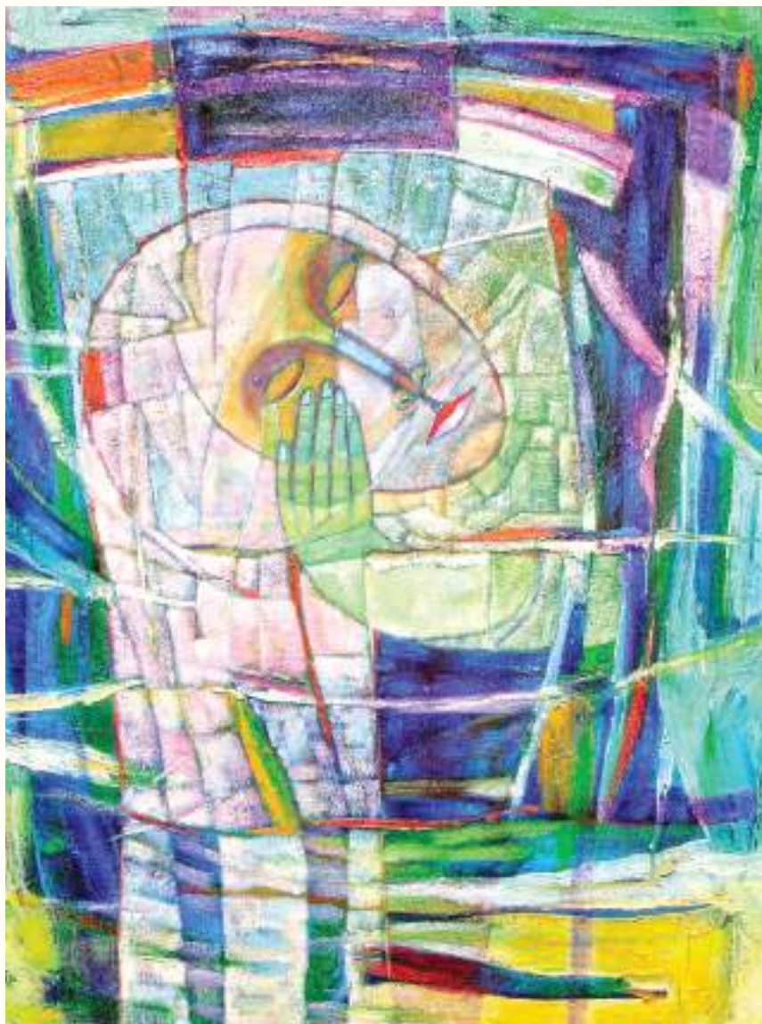
DESCANSO ÓLEO SOBRE LIENZO 100x90